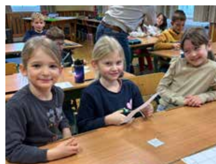
gemeinsame erste Unterrichtseinheit