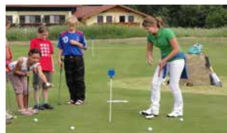
Ferienbetreuung im GCA

Im Rahmen der „Täglichen Bewegungseinheit“ bietet der GCA eine kostenlose Ferienbewegungseinheit für Kinder von 5 bis 10 Jahren an. Ein Vormittag voller Koordination, Balanceübungen und ersten Golfschlägen – betreut durch qualifizierte Trainerinnen und Trainer. Das kostenlose Angebot findet an regenfreien Tagen statt und dauert von 09:00 -13:00