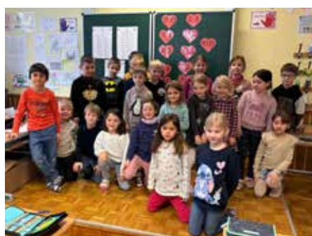
Besuch in der Volksschule