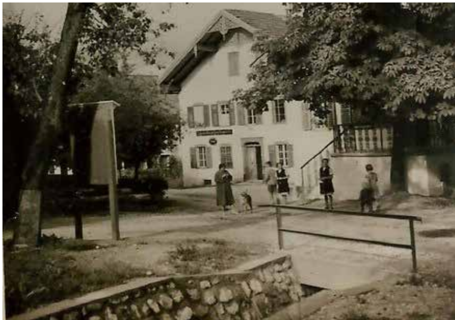
Das Geburtshaus von Joannes Karolus Schorn im Jahr 1928. Es diente als Gemeindeamt, Raiffeisenkasse, Gendarmerieposten und von 1894 bis 2009 auch als Post

Károly Huszár von Sárvár (* 10. September 1882 in Nußdorf am Attersee; † 27. Oktober 1941 in Budapest, Ungarn) war ein ungarischer Politiker, der als Ministerpräsident und kommissarisches Staatsoberhaupt von Ungarn von November 1919 bis März 1920 diente. Seine Amtszeit fiel in eine Periode von Revolutionen und Interventionen in Ungarn (1918–