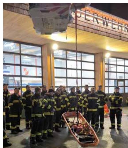
Einsatzmöglichkeiten mit der Drehleiter

Am 24. Februar 2026 durften wir die Kameraden der Freiwillige Feuerwehr St. Georgen im Attergau mit ihrer neuen Drehleiter (DLK) bei uns willkommen heißen. Das Fahrzeug wurde im Herbst 2025 offiziell in den Dienst gestellt. Im Rahmen der Präsentation erhielten die Feuerwehren des Pflichtbereichs Nußdorf a.A. die Möglichkeit, sowohl die neue Drehleiter als auch das innovative Bohrlöschgerät Drill-X näher kennenzulernen. Die anwesenden Kameraden bekamen einen umfassenden Einblick in die technische Ausstattung sowie in die vielfältigen Einsatzmöglichkeiten dieses modernen Einsatzfahrzeugs. Zusätzlich wurden weitere Gerätschaften vorgestellt, die auf großes Interesse stießen und einen regen fachlichen Austausch ermöglichten. Ein besonderer Schwerpunkt lag auf dem Bohrlöschgerät Drill-X. Dieses moderne System unterstützt die Brandbekämpfung insbesondere bei schwer