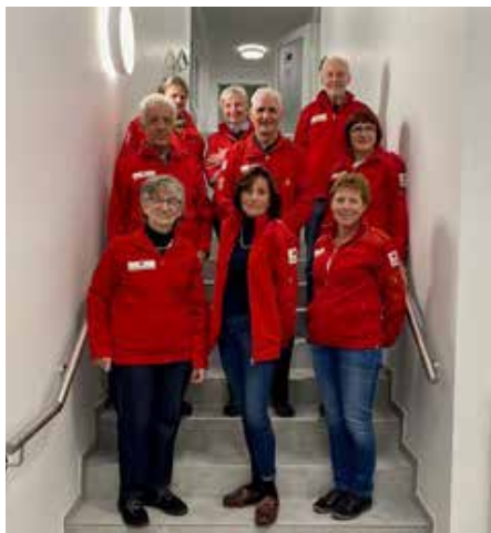
Team der RK-Ortsstelle St. Georgen im Attg.