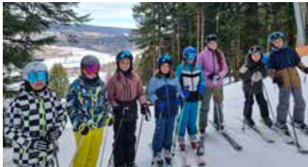
Skitag in Oberaschau