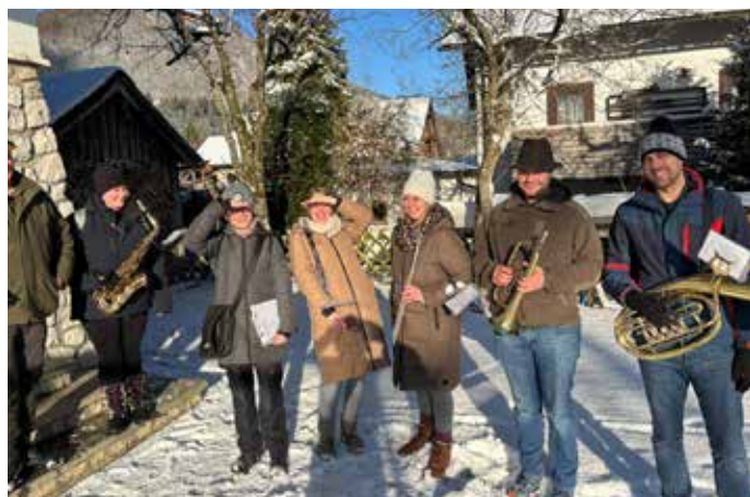
Auftakt ins Jahr 2026 beim Sternblasen