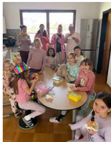
Pyjamatag in der Volksschule