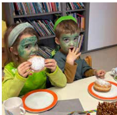
kleine Stärkung zwischendurch