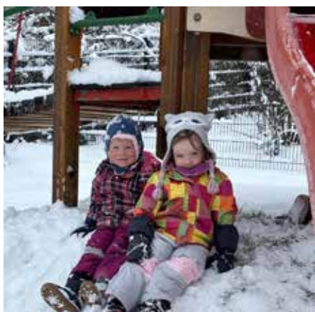
Viel Freude im Schnee