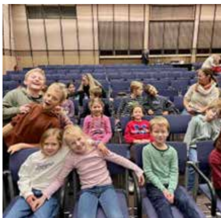
große Freude im Musical

Wir machten uns voller Vorfreude auf den Weg in den Stadtsaal Vöcklabruck, um das Musical „Die kleine Meerjung-