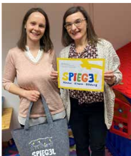
Gründungstreffen der Spiegel-Spielegruppe

Seit Februar 2026 ist unsere Spielegruppe in Nußdorf a.A. nun offiziell ein Teil vom SPIEGEL. Spiegel-Spielgruppen sind