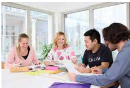
Unterstützung der Caritas Oberösterreich

Mit der Zusatzqualifikation als sozialpädagogische Fachkraft eröffnen sich zudem Jobchancen in der Kinder- und Jugendhilfe. Zusätzlich erlernen die Schüler den Beruf der Pflegeassistenz (ausgenommen Behindertenbegleitung) und können etwa in Krankenhäusern tätig sein. Die Ausbildung in der Altenarbeit wird in Teilzeit angeboten.