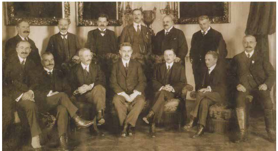
Das Kabinett Huszár

Danach kam es zu politischen Gerichtsverfahren, Unregelmäßigkeiten bei den Wahlen und Angriffen auf die Presseorgane der Partei. Die Wahlen im Januar gaben der Partei der Kleinbauern eine kleine Mehrheit im Gegensatz zu den Habsburgern und gegen die Christlich-Nationale Einheitspartei, die monarchisch und dynastisch gesinnt war. Das Resultat nahm eine zukünftige Krise zwischen beiden Tendenzen vorweg, obwohl die Mehrheit der Bevölkerung kein Interesse daran