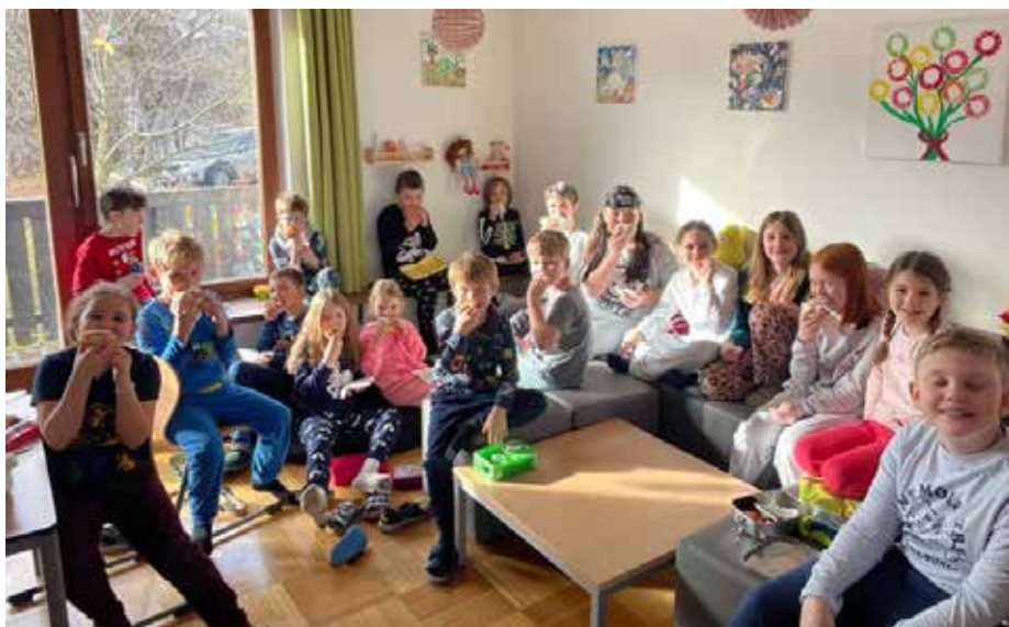
Faschingskrapfen dürfen natürlich nicht fehlen!