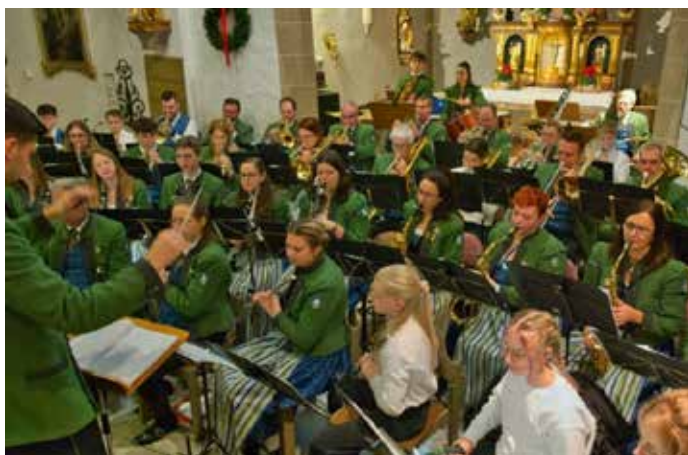
Jahreskonzert in der Pfarrkirche Nußdorf a.A.