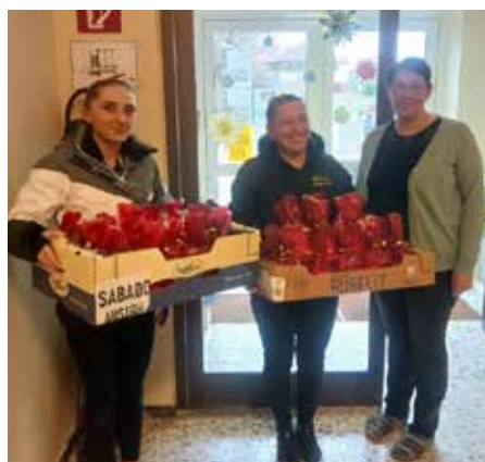
Vielen Dank für die Nikolaussackerl!

Die Schüler schnitten die Zweige zurecht und dekorierten die Kränze und Gestecke mit viel Kreativität. So entstanden individuelle Adventkränze für jeden Klassenraum.