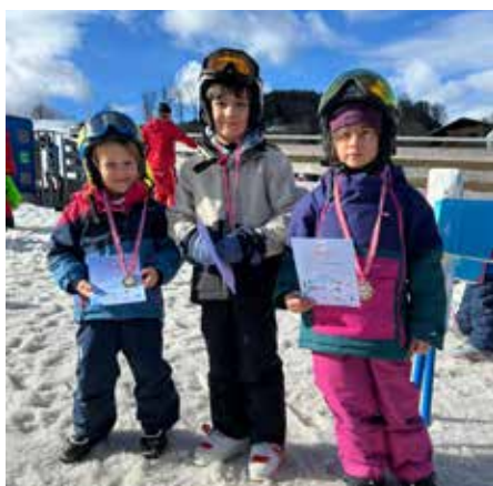
Skikurs in Oberaschau