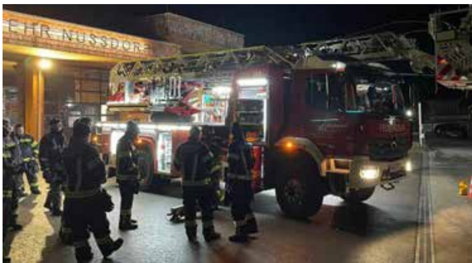
Drehleiter der FF St. Georgen im Attergau

Die Übung begann für die Jugendlichen mit einer altersgerechten theoretischen Einführung in die Abläufe eines technischen Einsatzes. Im Mittelpunkt standen dabei das korrekte Absichern der Unfallstelle, das fachgerechte Ausleuchten des Einsatzortes sowie wichtige Maßnahmen zum Eigenschutz, wie beispielsweise die persönliche Schutzausrüstung. Im praktischen Teil konnten die Jugendmitglieder ihr erlerntes Wissen direkt anwenden. Unter fachkundiger Anleitung probier-