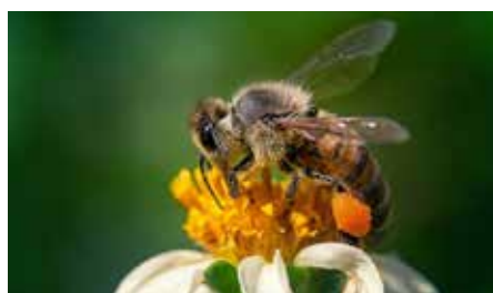
Biene mit Pollen-Höschen

Ein erstes gutes Zeichen ist reger Flugbetrieb am Bienenstock. Sobald die Temperaturen etwa 10 bis 12 Grad Celsius erreichen, starten die Bienen zum sogenannten Reinigungsflug. Viele ein- und ausfliegende Bienen deuten auf eine ausreichende Volksstärke hin. Besonders auffällig ist der Polleneintrag. Mit kleinen gelben, orangefarbenen oder sogar rötlichen „Pollenhöschen“ kehren die Sammelbienen zurück. Pollen ist die wichtigste Eiweißquelle für die Aufzucht der Brut. Wird Pollen eingetragen, bedeutet das, dass die Königin Eier legt und das Volk zu wachsen beginnt. Bei der ersten Durchsicht kontrolliert der Imker das