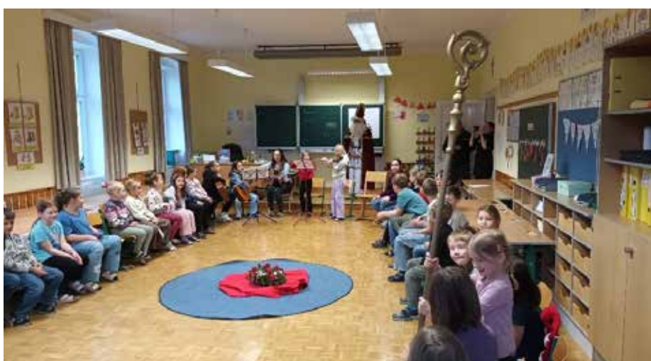
Der Nikolaus und seine „dunklen Gesellen“!